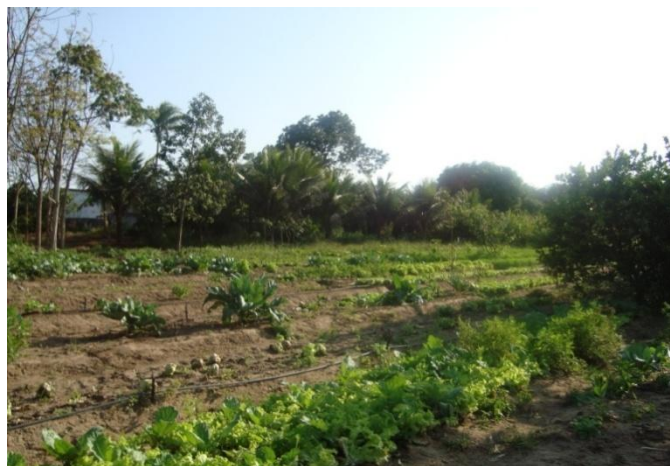
Figura 02: Sítio Almeida

A experiência de agricultura agroecológica nessa propriedade demonstra a viabilidade da implementação dessa atividade na área, considerando que toda terra é produtiva, passando por um processo de recomposição, pois a terra se encontrava sem cobertura vegetal e sem água. Através de ações específicas dos agricultores juntamente com o Sindicato dos Trabalhadores foi possível reverter esse quadro de desolação, buscando reflorestar a área, na qual hoje cultiva plantas nativas em meio a frutas, hortaliças, plantas medicinais, criação de aves, peixes, etc. Foi construído também uma barragem subterrânea com uma linhagem agroecológica, visando economizar de água.