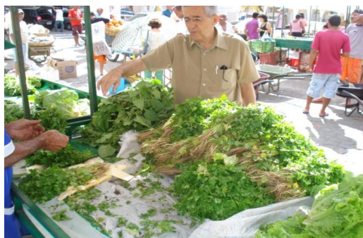
Figura 03: Feiras Agroecológicas.

O escoamento da produção agroecológica dos produtos cultivados passa a ser feito em sua maioria diretamente para as feiras agroecológicas (figura 03), em Lagoa Seca na feira semanal do município e na cidade de Campina Grande (na pirâmide do parque do povo, na UFCG, no Catolé e no Museu do Algodão). Existindo dois tipos feiras: a do produtor organizadas pela EMATER e feiras agroecológicas (organizadas pelo Poló Sindical - ECOBORBOREMA). Evidenciando que a certificação não aparece como uma dimensão determinante, pois existe uma relação de confiança no contato face-a-face do produtor-consumidor.